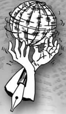
මහාචාර්ය ආර්යරත්න ඇතුගල ජනසන්නිවේදන අධ්‍යයන අංශය කැරණිය විශ්වවිද්‍යාලය