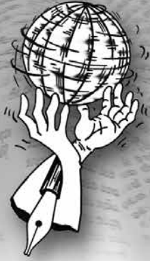
මහාචාර්ය චන්ද්‍රසිරි රාජපක්ෂ ජනසන්නිවේදන අධ්‍යයන අංශය කැලණිය විශ්වවිද්‍යාලය